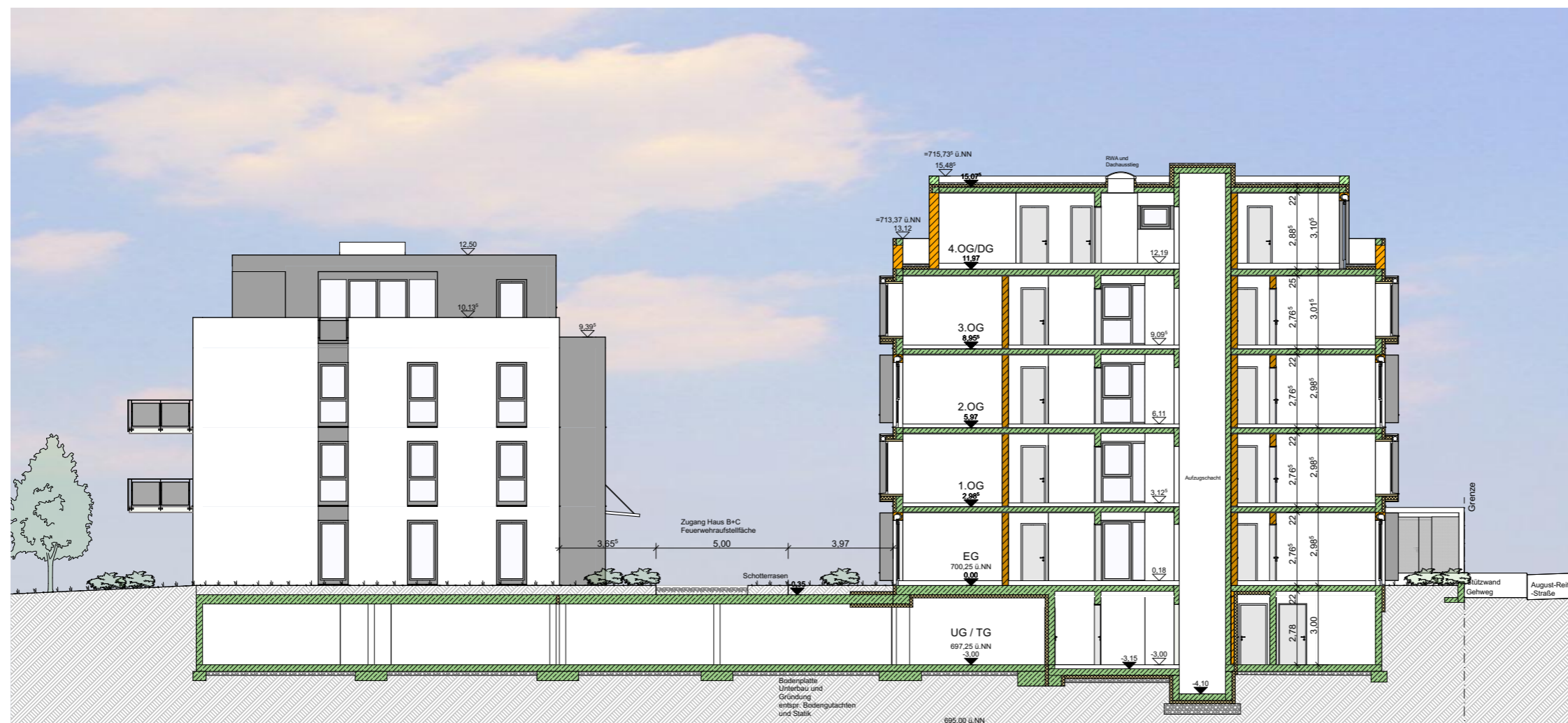
06 SO Haus B